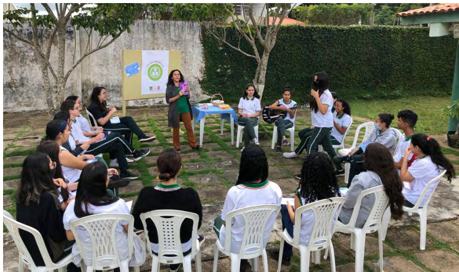
Estudantes da rede estadual cearense durante encontro dos Círculos de Leitura

obras previamente selecionadas. Esses jovens contam com o apoio e acompanhamento de professores, que também passam por uma formação para desempenhar esse papel.